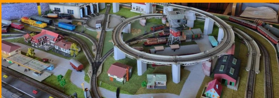
Märklinbana efter spårplan 14

Att köra modelltåg är roligt för järnvägsintresserade i alla åldrar. Vi har en Märklinbana som vem som helst kan provköra, byggd enligt spårplan 14 i Märklins legendariska spårplansbok. Vi har dessutom en Märklinbana där man fokuserat mer på landskapet och en tvårälsbana som naturtroget visar sträckan Örnköldsvik-Moliden. Därtill finns ett större bord i godsmagasinet där medlemmarna kan bygga upp sina egna anläggningar.