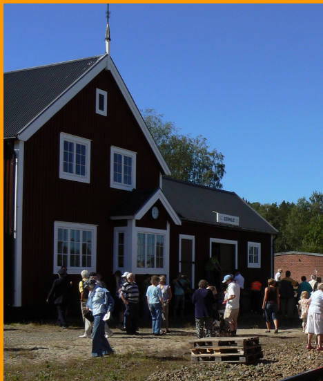
Klarblå himmel över Björnsjö station