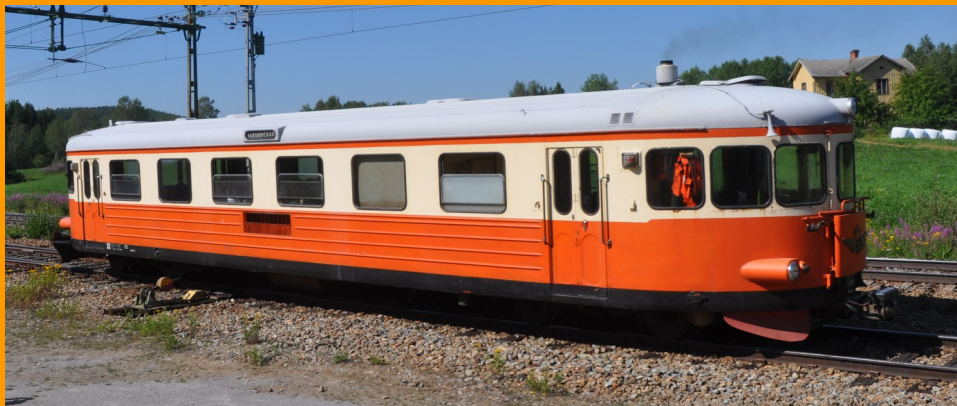
Y8 1135 under Björnsjö marknad